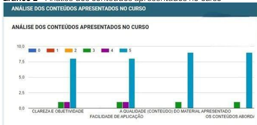
Gráfico 2 - Análise dos conteúdos apresentados no curso

A análise do questionário referente aos conteúdos apresentados no curso demonstra uma avaliação predominantemente positiva por parte dos participantes. O gráfico evidencia que a maioria das respostas se concentra na pontuação máxima (5), o que indica um alto nível de satisfação em relação à clareza, qualidade, aplicabilidade e coerência dos conteúdos abordados.