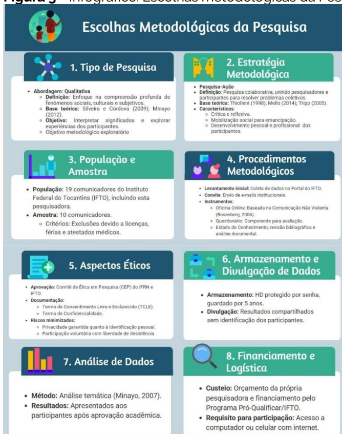
Figura 3 - Infográfico: Escolhas metodológicas da Pesquisa

Nesta parte, abordaremos os procedimentos adotados na realização desta pesquisa. O infográfico abaixo aponta as escolhas metodológicas: tipo da pesquisa, estratégia metodológica, população e amostra; procedimentos adotados; aspectos éticos; armazenamento e divulgação de dados; análise de dados; financiamento e logística.